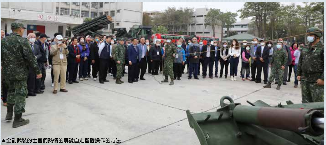
▲全副武裝的士官們熱情的解說自走榴砲操作的方法。