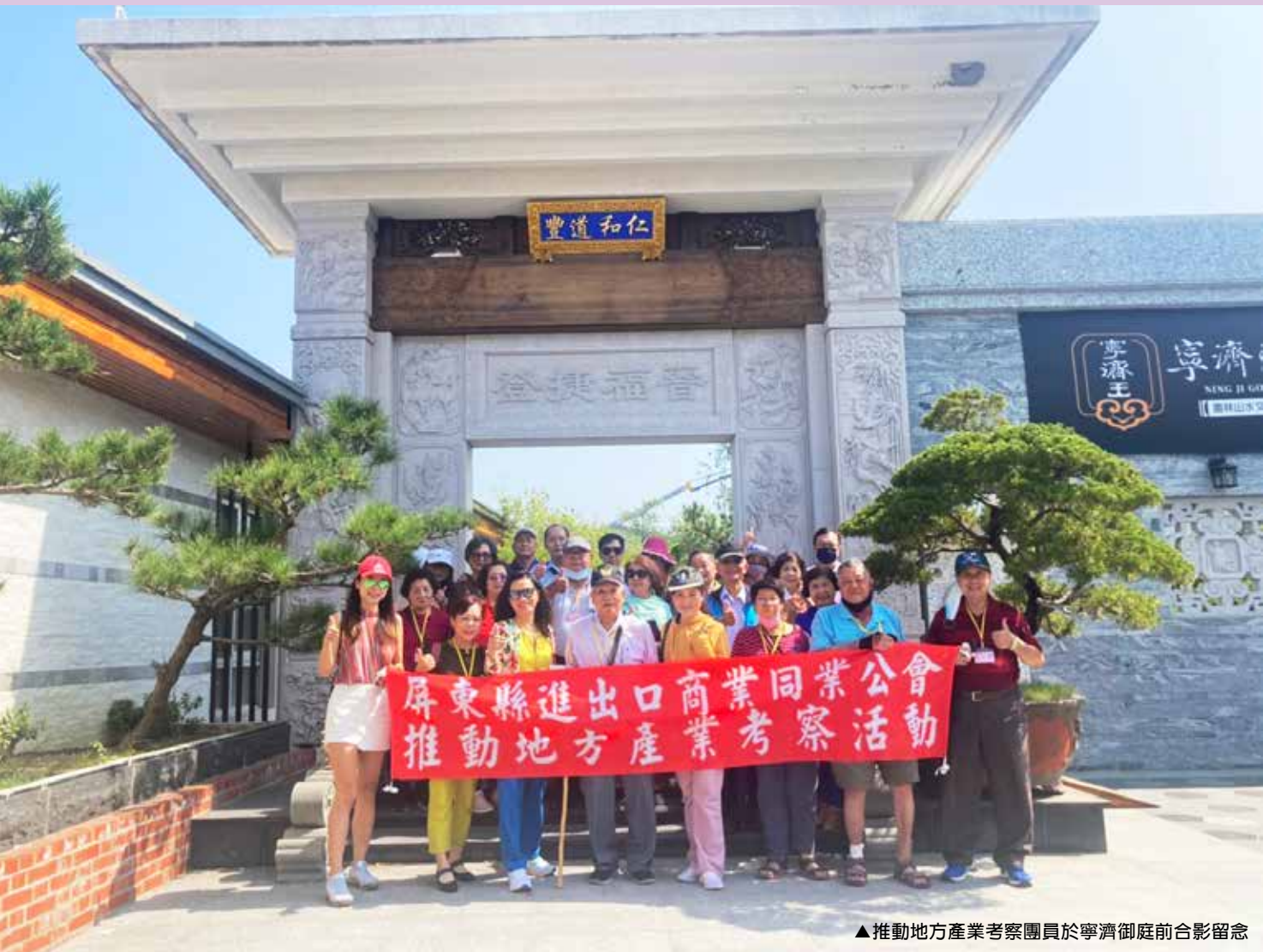
▲推動地方產業考察團員於寧濟御庭前合影留念