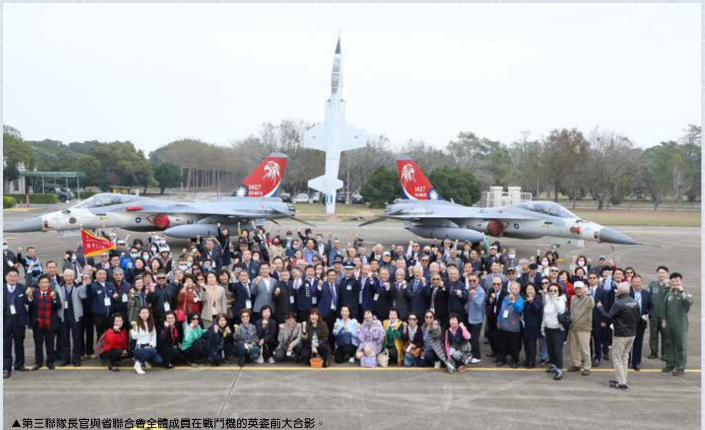
▲第三聯隊長官與省聯合會全體成員在戰鬥機的英姿前大合影。

陸軍士官們實際操練了多項大型的精銳武器，每一發射擊與吶喊都震撼人心，五八砲指部也提