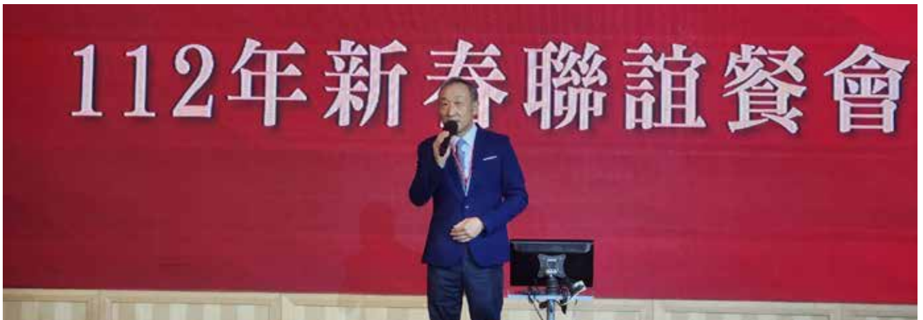
▲王理事長歡迎全體貴賓蒞臨

接著卡拉OK歡唱，來自全省的歌王、歌后優美的歌聲響徹整個會場，聯誼會在歡樂中順利、圓滿結束！再次感謝您的蒞臨，招待不週也請包函。