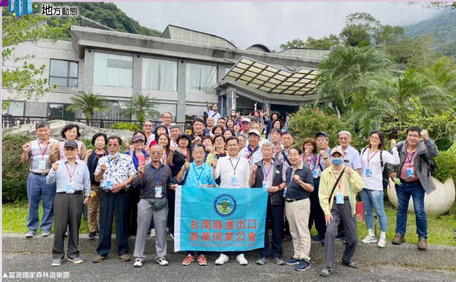
▲富源國家森林遊樂園