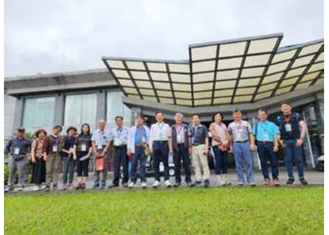
▲會員們可愛又曼妙的樂譜照

此次行程三天兩夜在王理事長領隊下，會員們漫步在大自然的芬多精洗滌中，拍下許多美麗的照片，裝著歡笑的回憶，提著滿滿的伴手禮，當大家依依不捨時，此刻火車已鳴笛中，會員們趕緊手拉著行李在月台中驚險又刺激趕火車中劃下完美的句點，讓參加的會員們感到永生難忘，滿心期待著下一次的旅行！