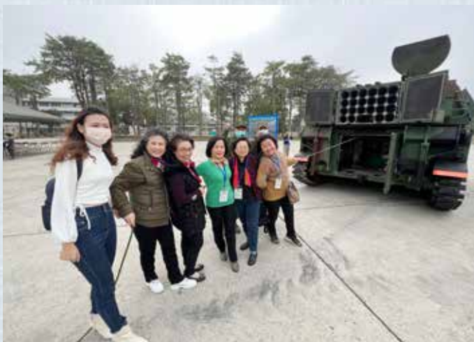
▲五八砲指部長官與夥伴們在雄壯威武的大砲前合影。