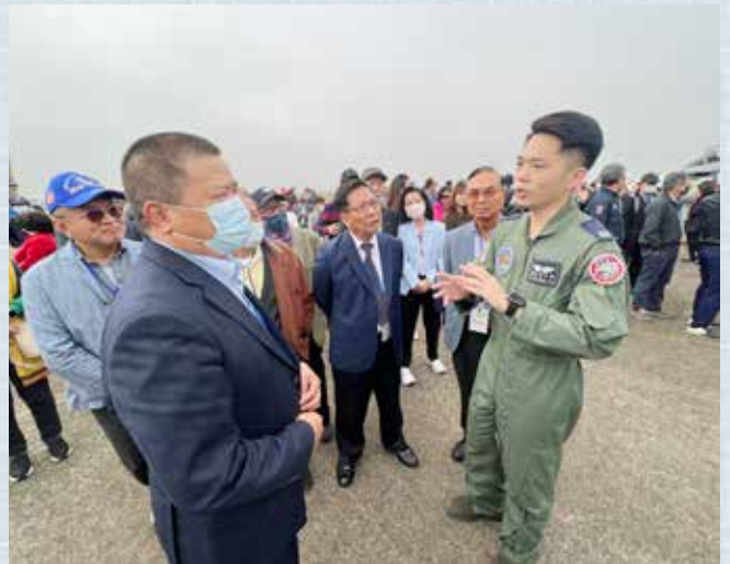
▲飛官為參訪夥伴做現場展示飛機的詳細介紹。

導覽軍官表示:空軍弟兄們擔任24小時全天候防空警戒任務，近海巡邏等各式空中作戰任務，不分晝夜守護臺海領空安全，由IDF戰機保持武裝待命隨時起飛，當我國領空發現不明航空器或緊急危難時，警戒待命人員會立即進入座艙，並於五分鐘內升空以攔截或摧毀來犯不明之目標，宣示我國主權及確保國人安全。