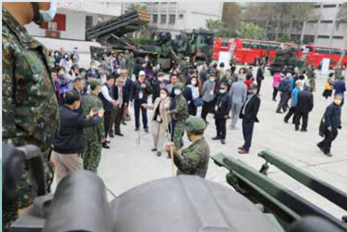
▲士官們教導自走榴砲讓敬軍團夥伴體驗。