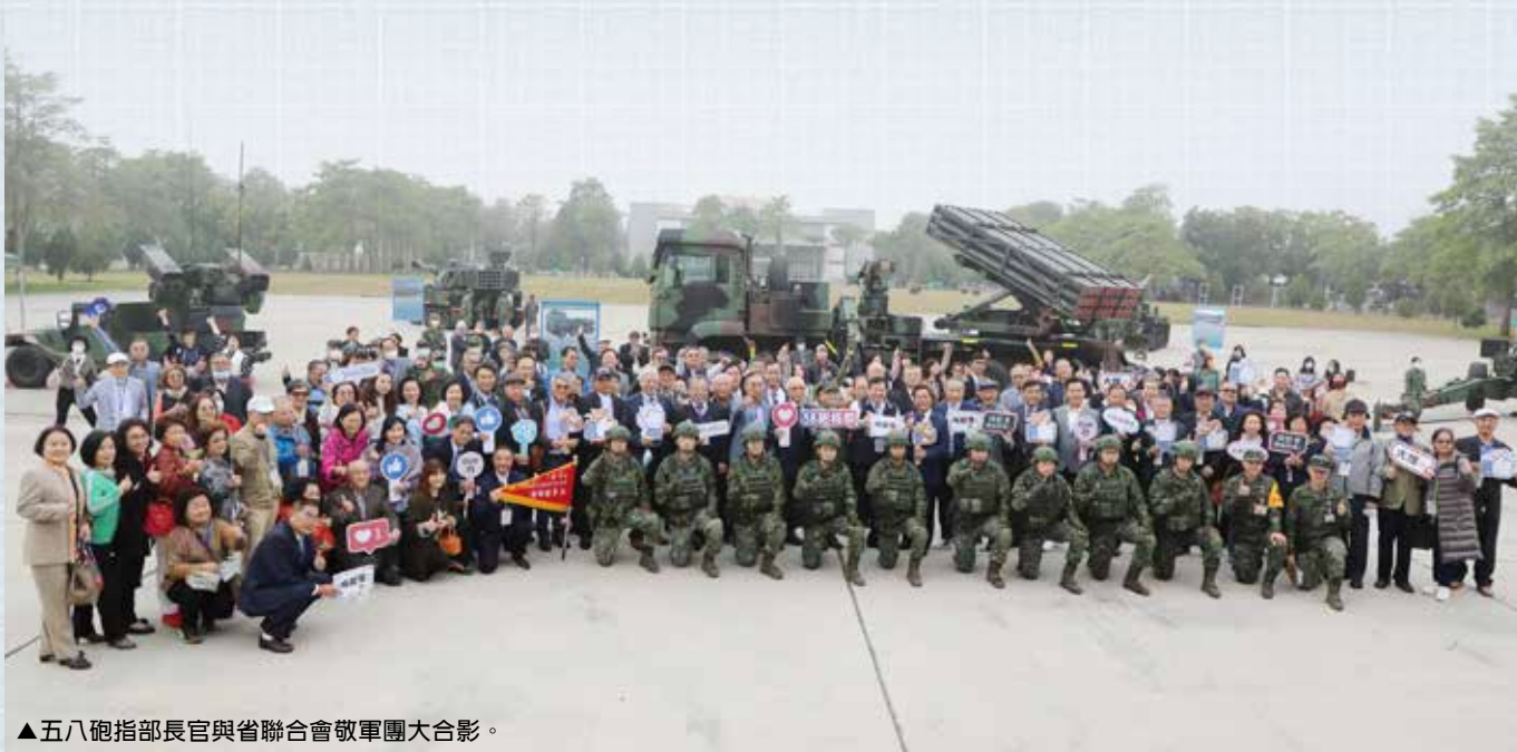
▲五八砲指部長官與省聯合會敬軍團大合影。

1980年代在時任總統蔣經國指示下，中華民國政府藉著美國政府的協助及技術移轉即展開「自製防禦戰機」，F-CK-1經國號戰鬥機(IDF)就此誕生。