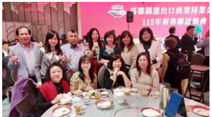
▲地方公會總幹事、秘書長