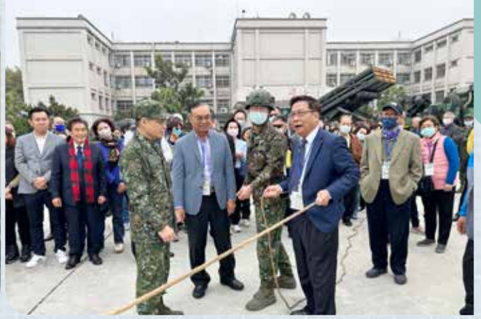
▲莊理事長也寶刀未老親自下海體驗操作。