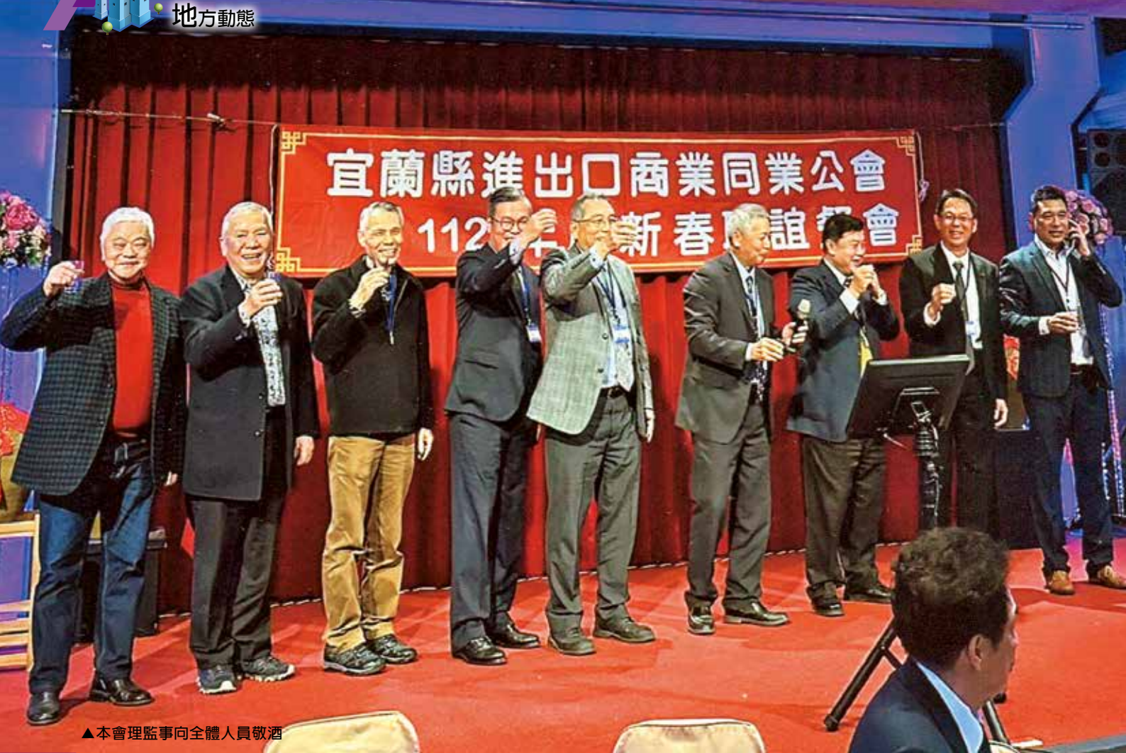
▲本會理監事向全體人員敬酒