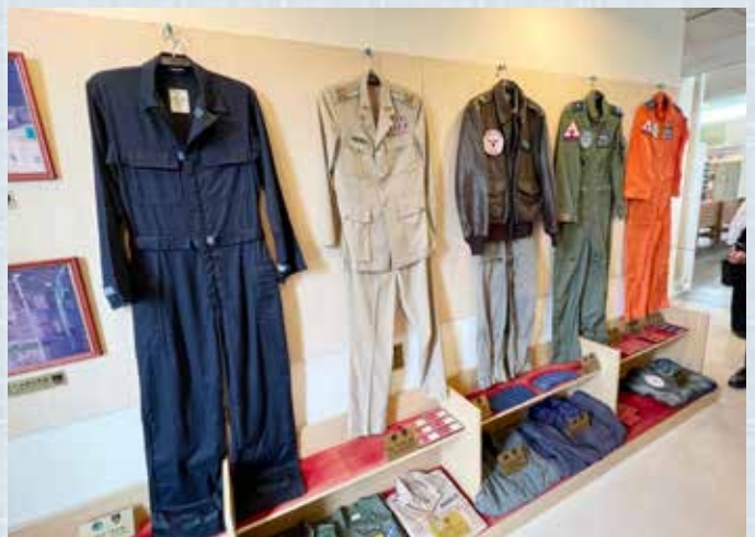
▲美軍駐清泉崗基地足跡館內陳列各式帥氣的飛行服裝。