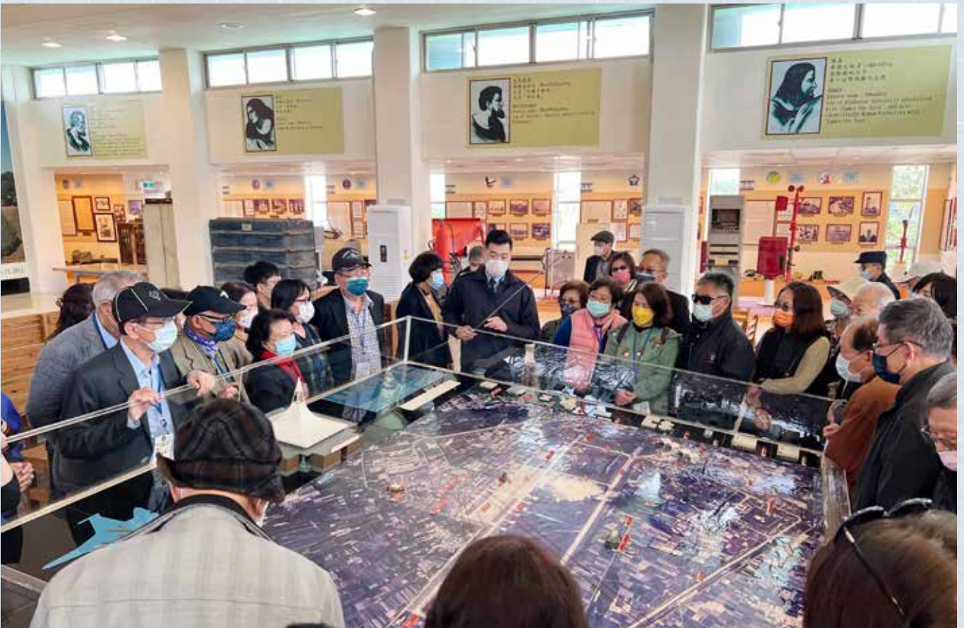
▲導覽軍官很詳細的解說美軍駐清泉崗基地的歷史與沿革。