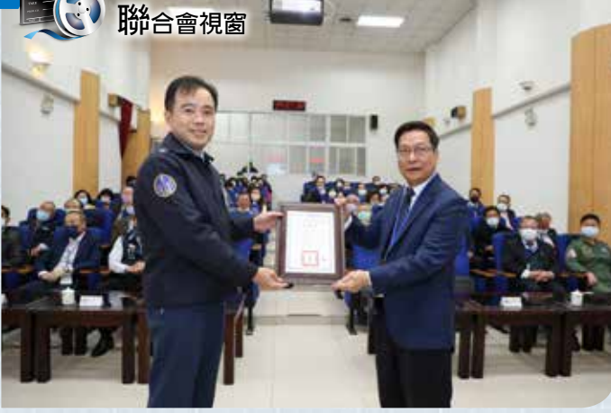
▲第三聯隊長官回贈感謝狀感謝此行敬軍活動。