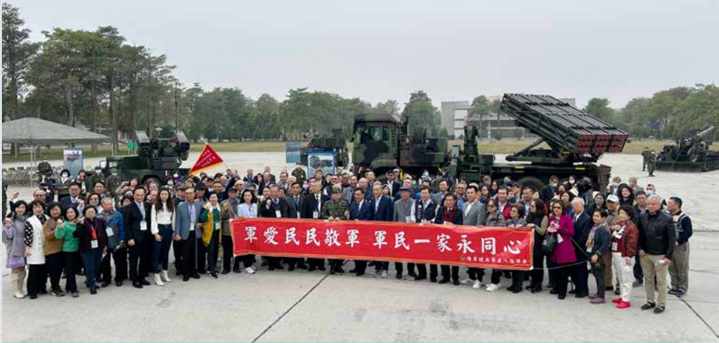
▲貴賓們紛紛與戰車合影留念。