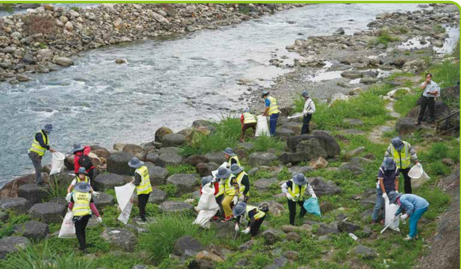
▲112年玉管處38週年處慶淨川活動照片

榮獲國史館臺灣文獻館「111年文獻書刊-推廣性書刊類」佳作，書中依循玉山國家公園國土保育歷程軌跡，在歷經成立孕育期開發與保育衝突、草創奠基家園、強化保育工作到提升高山遊憩、行銷國際與世界接軌，並面臨921大地震、八八風災等天災地變的挑戰，玉管處從業人員秉持國家公園目標攜手克服難關。