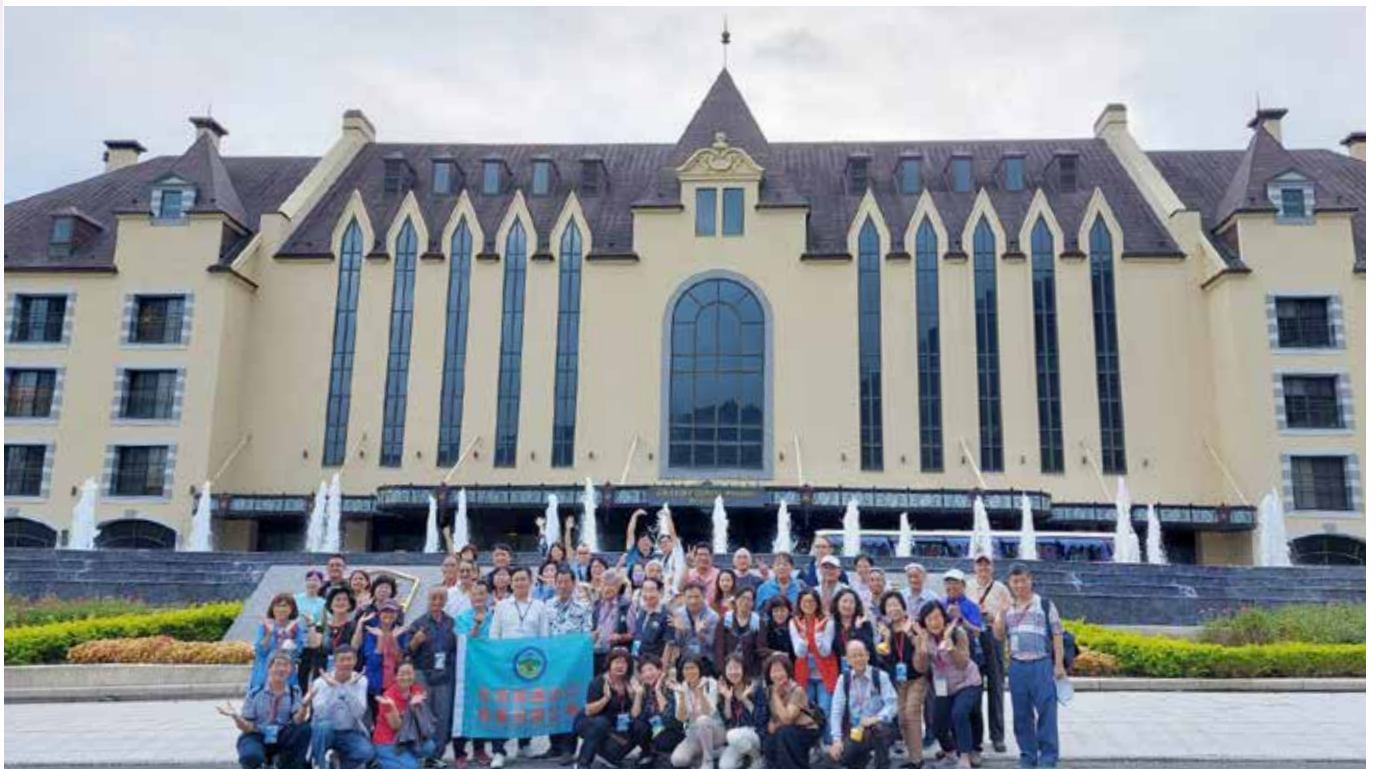
▲富源國家森林遊樂園