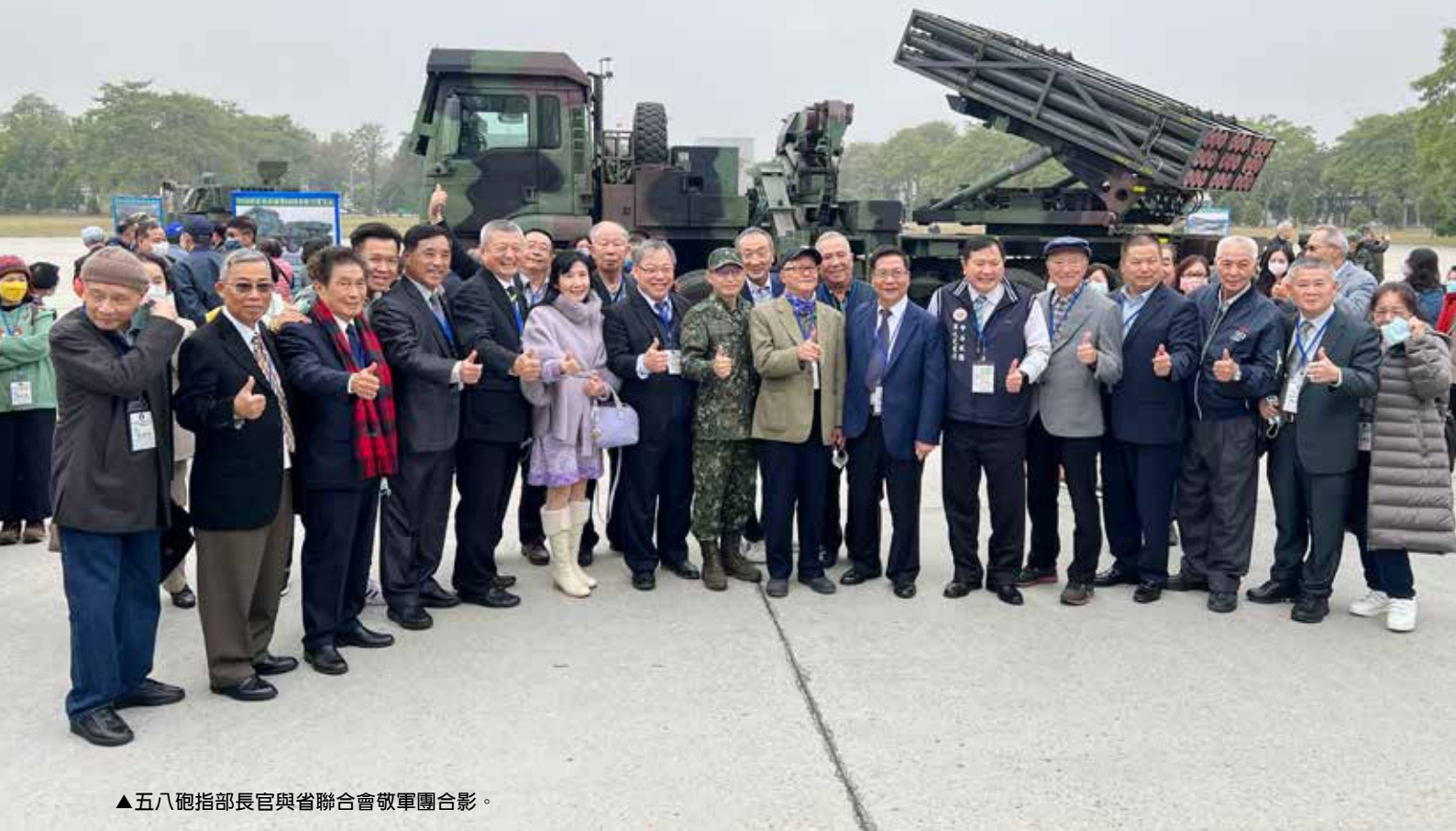
▲五八砲指部長官與省聯合會敬軍團合影。