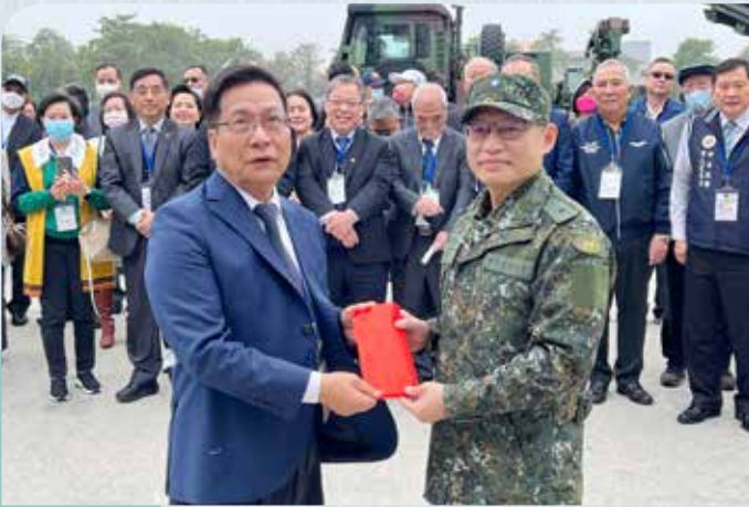
▲莊理事長代表省聯合會致贈加菜金給五八砲指部。