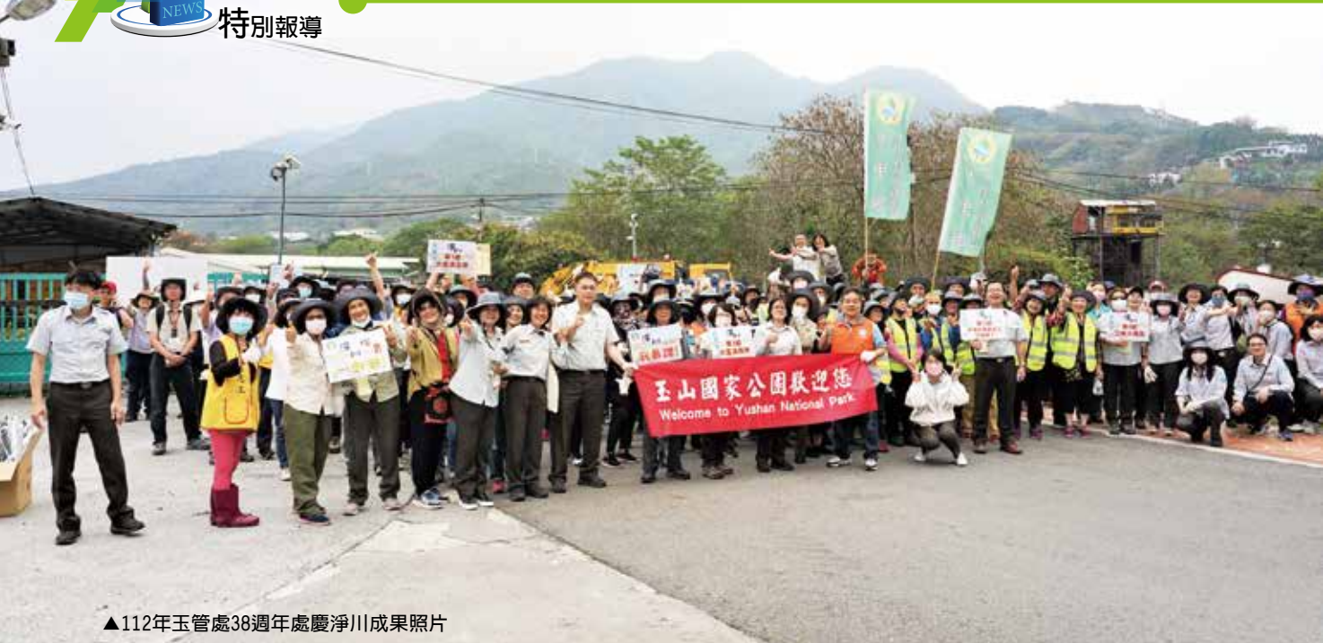
▲112年玉管處38週年處慶淨川成果照片