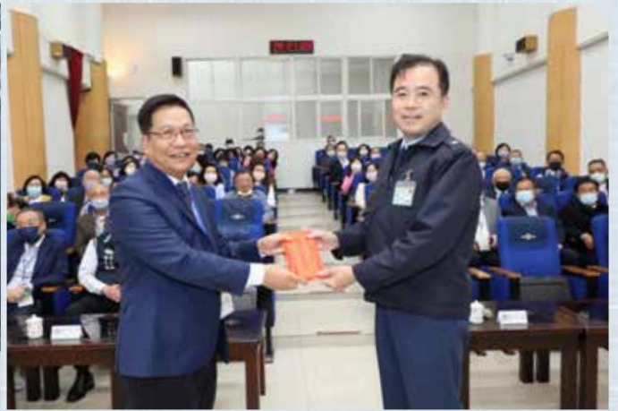
▲莊理事長代表省聯合會致贈加菜金給空軍第三聯隊。