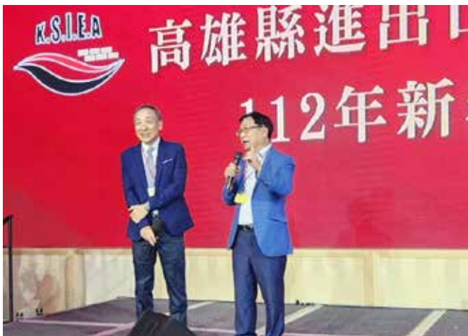
▲莊省長祝福大家身體健康