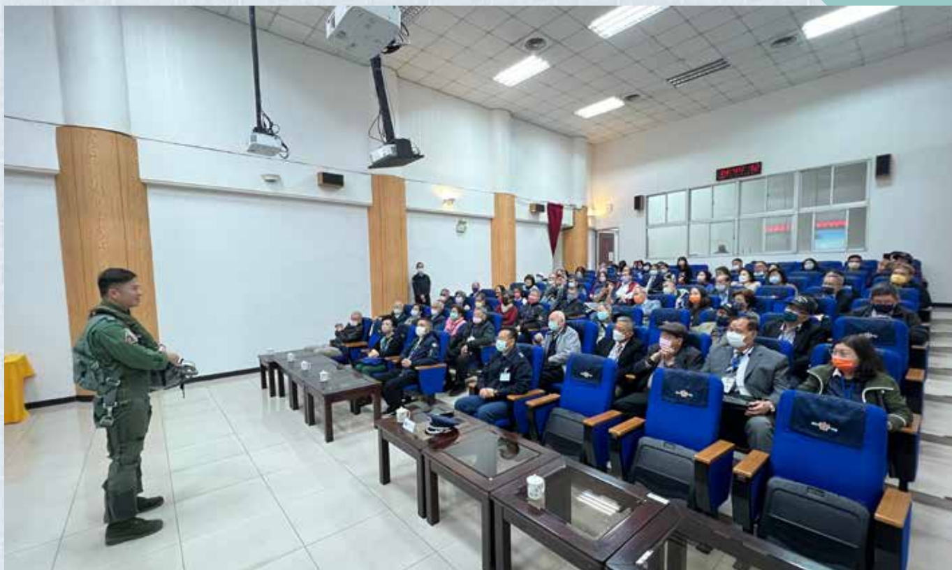
▲讓人敬仰的飛官近距離介紹平時難得一見的特殊裝備。

供各位參與敬軍的夥伴們一起體驗及參觀震撼的大型軍事武器，第一項自走榴砲，重量23,568公斤(未裝載)，全長 9.17公尺(砲管向前)，高3.28公尺，擁有405匹馬力，火砲口徑155公厘，最大射程18,100公尺，射速：4發/1分鐘，持續：1發/1分鐘。第二項牽引式155公厘榴彈砲，重量5760公斤，全長 7.3公尺，高1.805公尺，火砲口徑155公厘，最大射程可達14,600公尺，射速最大：2發/分鐘，持續：1發/分鐘。第三項自走式雷霆2000多管火箭系統，重量27公噸(未載)，全長9.8公尺，全高3.8公尺，擁有馬力400匹馬力，發數20發/9發/6發，射程 7-15K/15-3 K 0/ 30-45K，射擊時間25秒/52秒/44秒。第四項8吋(203公厘)自走榴砲，重量28,350公斤(戰鬥載)，全長10.731公尺，高3.14公尺，馬力足足達405匹馬力，火砲口徑203公厘最大射程更可達22,900公尺/普通彈、35,000公尺/火箭增程彈，射速最大：1.5發/分鐘、持續：0.5發/分鐘。第五項復仇者飛彈車，重量3,898公斤(含飛彈塔)，迴旋極限擁有360度，俯仰極限-10度至68度，最大射程8,000公尺，有效射高3,800公尺，飛行速度 2.2馬赫，飛彈最大載彈單量 8枚。看