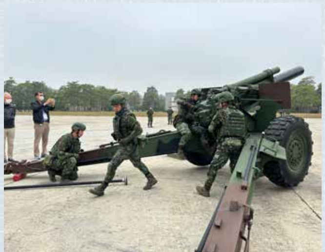
▲飛官為參訪夥伴做現場展示飛機的詳細介紹。

本會敬軍活動第二站來到臺中「陸軍第五八砲兵指揮部」，當戰事爆發後地面上最後一道防線非陸軍莫屬，隸屬於陸軍第10軍團的砲兵第58指揮部，為中部地區地面作戰的主要火力支援部隊。單位除野戰砲兵營，另轄有防空砲兵及多管火箭單位，提供精準精確的火力，為陸軍執行強而有效打擊與堅實防禦任務。