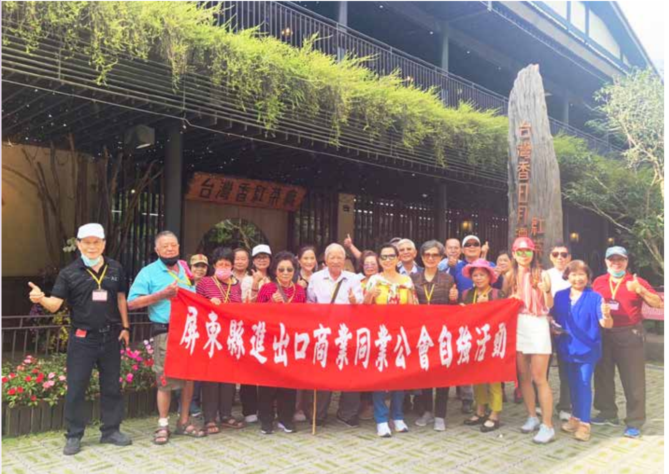
▲團員於「HOHOCHA喝喝茶」合影留念

媽祖神尊的亭閣。從亭閣俯瞰，像是飄揚的水袖，橋緻石雕，每棟林木間的樓閣更展現建築美學，不禁令人流連按讚！