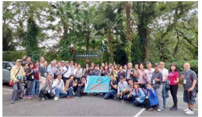
▲富源國家森林遊樂園