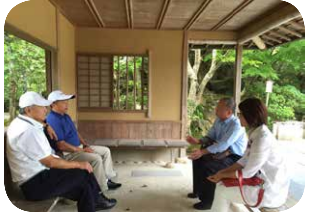
● 兩位團長在由志園與旅行社討論颱風來襲行程變更事宜。

參訪出雲大社後，繼續往西前進至「由志園」園區內午餐，餐後大夥漫步於園區內，始發現這座迴廊式的日式庭園，其景色絕不亞於岡山後樂園，尤其溫室栽培的牡丹花出奇的豔麗是該園的一大特色，而後專車駛向日本名列第11位的世界文化遺產－「石見銀山」，顧名思義，此處在日本戰國時代其銀礦產量佔全球的30%，對當時江戶時代的經濟貢獻極大，直到明治維新，由於經濟效益遞減後，最終在1943年昭和時代封山，當地居民感於銀山具有其不可磨滅的經濟歷史價值，遂組織「銀道振興協進會」民間組織，在2007年向聯合國教科文組織UNESCO爭取列入世界文化遺產名錄內。