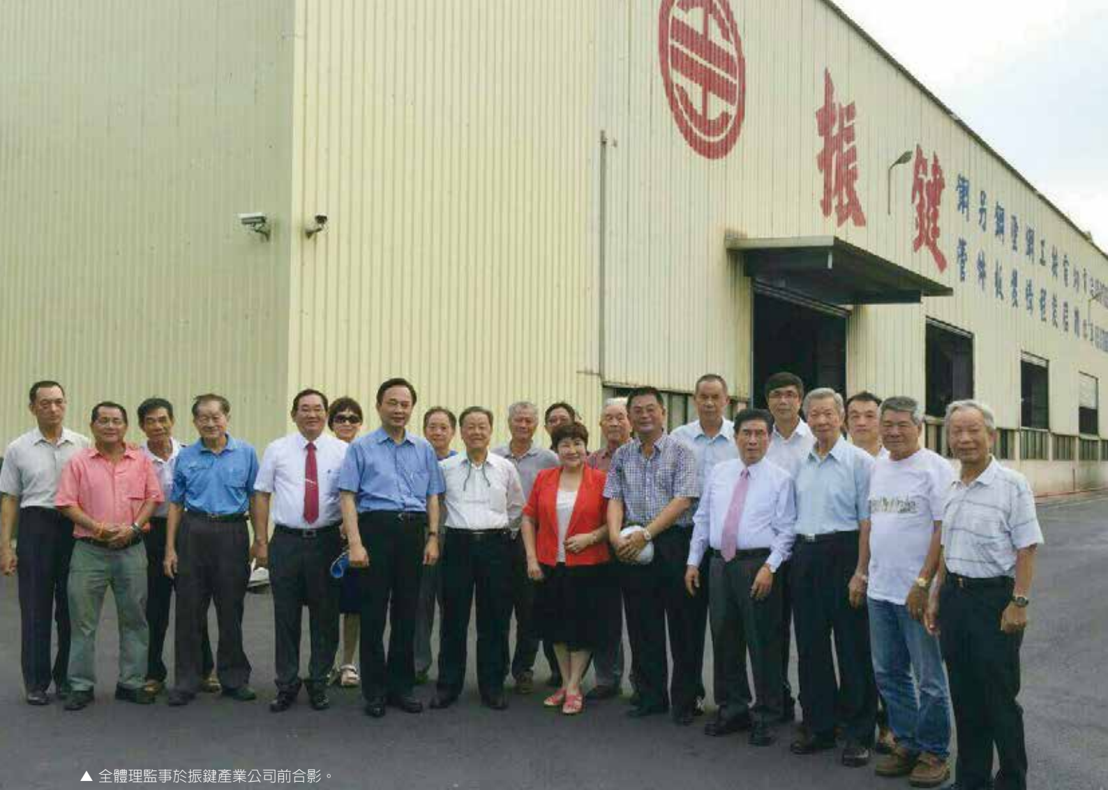
▲全體理監事於振健產業公司前合影。