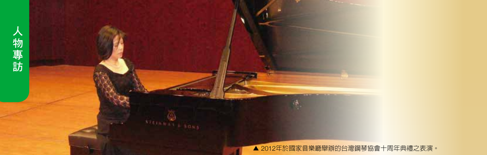
▲ 2012年於國家音樂廳舉辦的台灣鋼琴協會十周年典禮之表演。