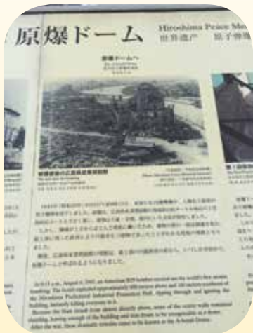
● 原爆遺址是前廣島產業獎勵館。

炸的城市，雖然事過境遷已達半個世紀之久，廣島市在重建下也已成爲西日本經濟文化的中心，市容繁華，當年一片廢墟破落景象已不復存在，但原子彈爆炸後帶來的傷害，永遠留在世人的心中，戰爭帶來的可怕，遺禍後代子孫，歷史終將寫下人類最不堪的一頁。廣島慘劇也提醒世人千萬不可再重蹈覆轍，因此，廣島原爆遺址已成爲世界祈求和平的代表性城市。