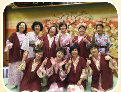
● 訪問團寶眷暨女性團員。