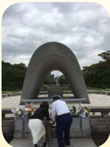
● 原爆罹難者紀念碑 / 碑文刻著：請安息吧，我們不會讓歷史重演！