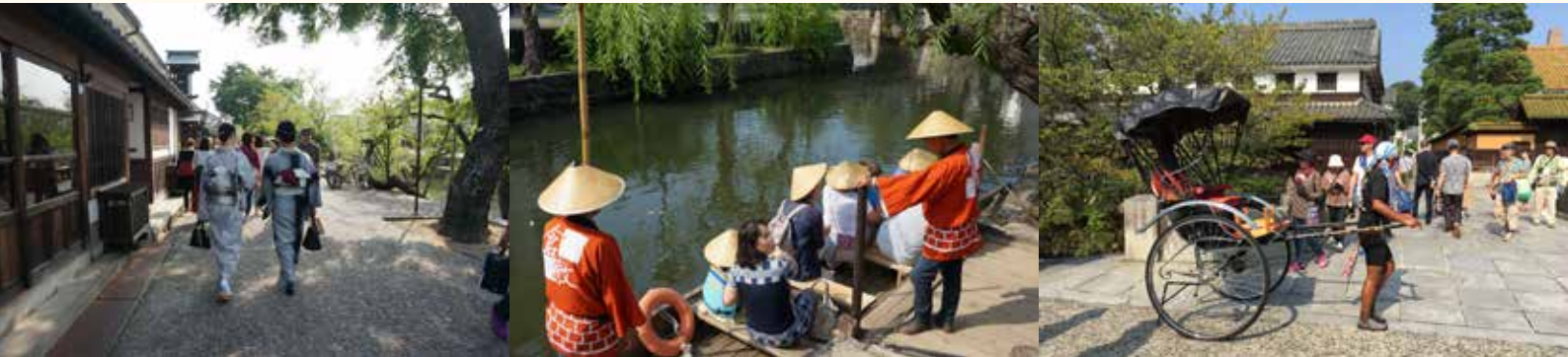
● 別具江戶幕府風情的倉敷川，距今約有 350 年歷史。

參觀倉敷川後，驅車循著岡山自動車道前往鳥取縣，於傍晚時分抵達倉吉市的三朝溫泉，下榻於齊木別館大飯店。