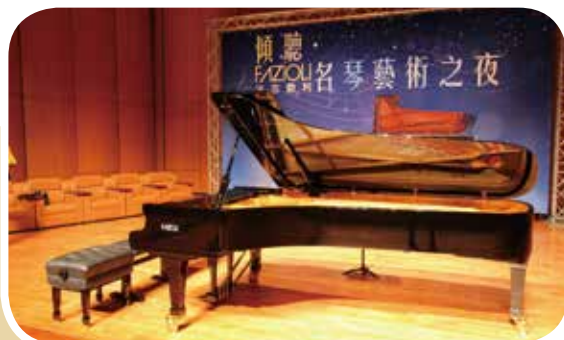
▲ 台中市政府新購入的Fazioli F308。