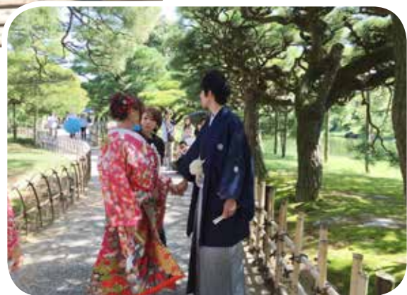
● 結婚出外景的寶地。