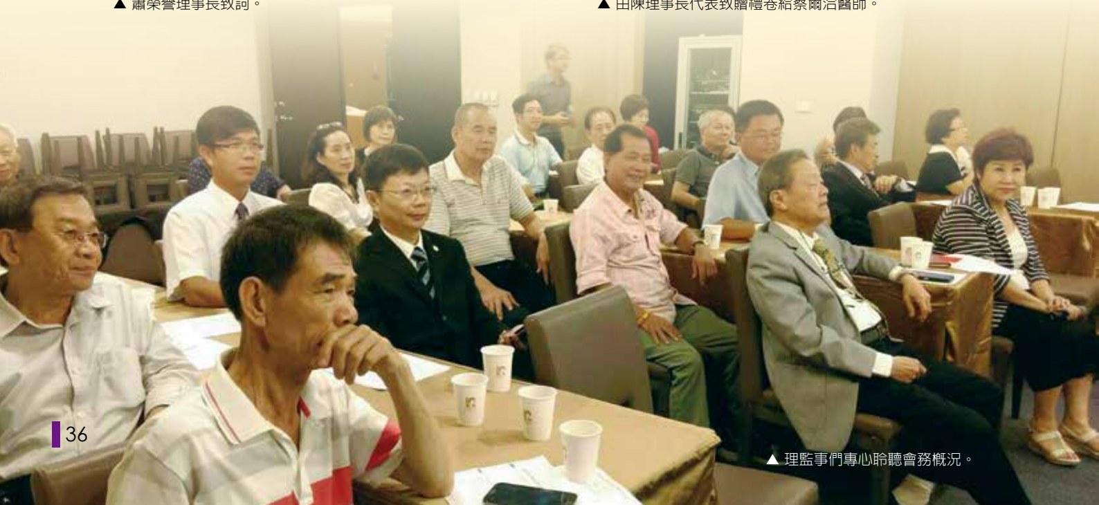
▲ 理監事們專心聆聽會務概況。