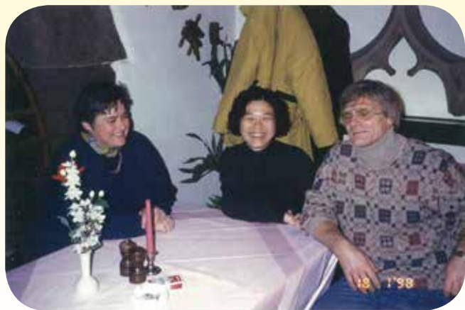
▲ 關係密切的德國房東家庭。