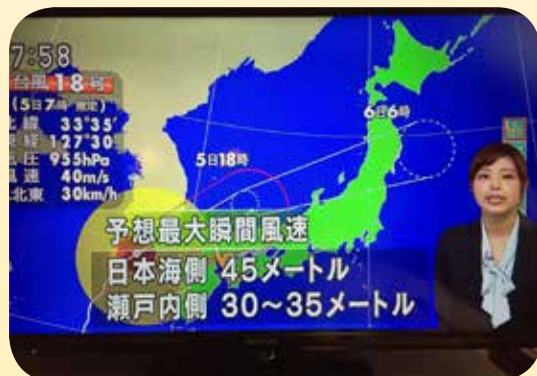
● 訪日期間適逢第18號颱風來襲。