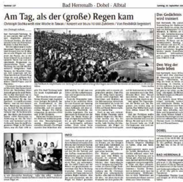
▲ 德國報紙報導「1056鋼琴密碼」的相關內容。