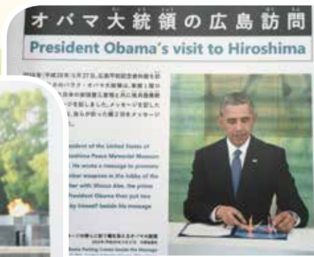
● 美國總統歐巴馬曾經在2016年5月27日訪問廣島。

廣島和平紀念公園巡禮一週後，在我們行將離去之際，晴朗的天空突然黑雲密布，下起小雨，異常的天象，彷彿上天在爲原爆冤魂留下不捨的淚珠，團員一行也帶著一絲絲莫名的沉痛，倖倖然離開了原爆遺址。訪日專車再次駛上瀨戶內海大橋，途經日本二次大戰史上赫赫有名的「大和艦」海軍基地 - 吳港，繼續往四國愛媛縣的今治市邁進，並依