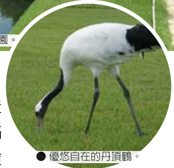
● 優悠自在的丹頂鶴。

今早揮別高松市鹽江溫泉後，循著瀨戶中央自動車道(高速公路)過瀨戶內海前往山陰地區的鳥取縣鳥取市，中途路過岡山縣，順道前往日本三大名園之一的「岡山後樂園」特別名勝區參觀，這座日本有名的迴遊式庭園曾經是一代藩主池田綱政的別墅，也是江戶時代的庭園代表作，在遊園途中最令人印象深刻的莫過於園區內的壹對丹頂鶴，其優雅的神韻頗具江戶時代的文化內涵，深得日本人的喜愛，可說是後樂園最具可看性的景緻。