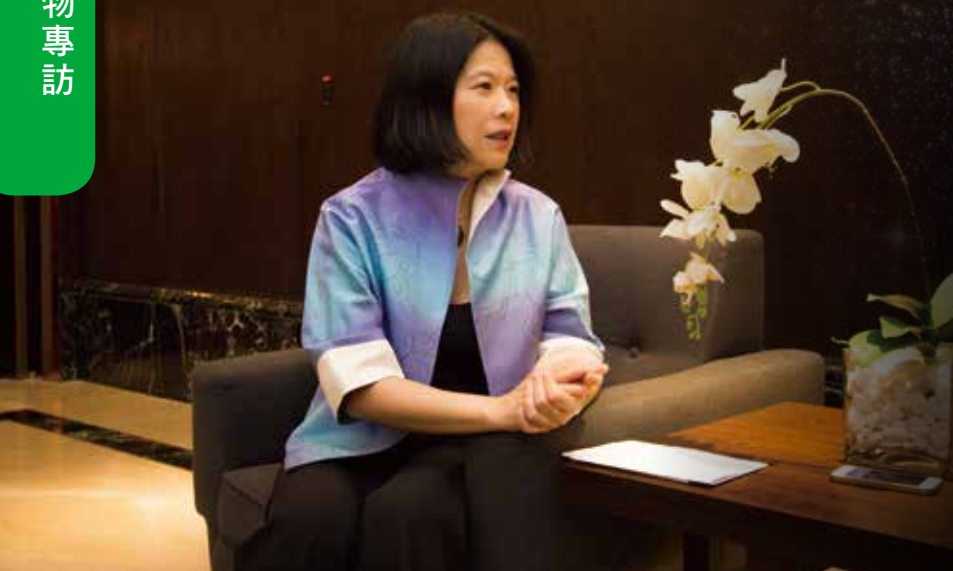
▲ 簡老師希望有更多人能感受古典音樂之美好。