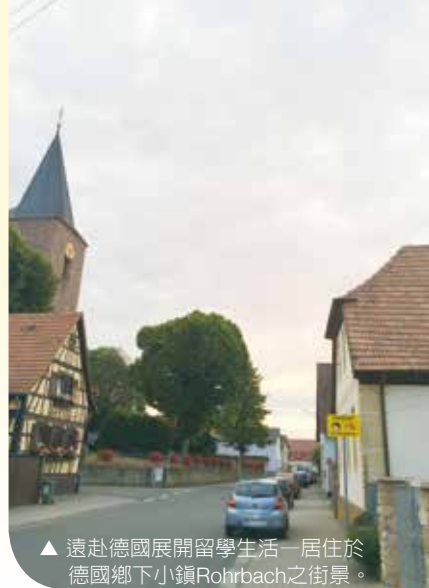
▲ 遠赴德國展開留學生活—居住於德國鄉下小鎮Rohrbach之街景。