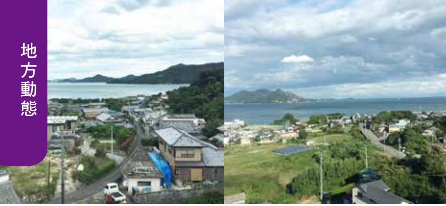
● 瀨戶內海沿途民宿景色美不勝收。