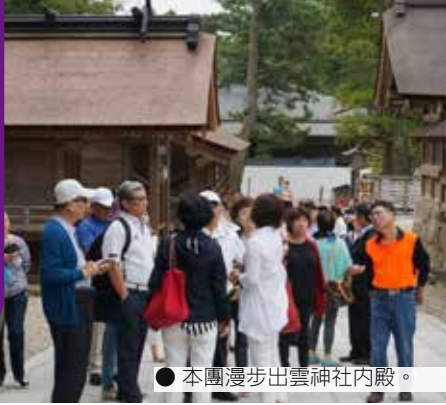
● 本團漫步出雲神社內殿。