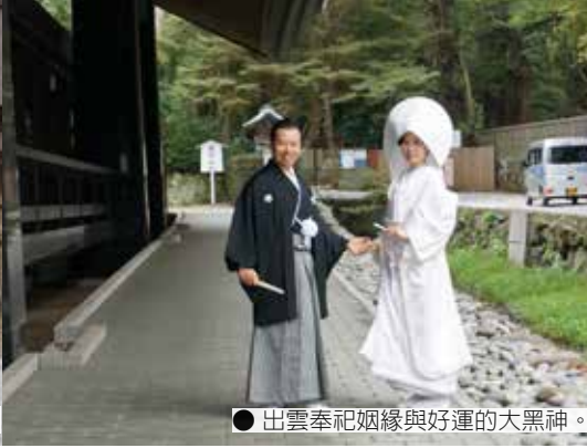
● 出雲奉祀姻緣與好運的大黑神。