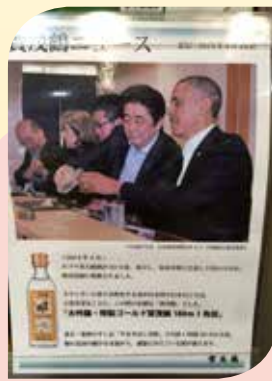
● 飯店內小賣店販售安倍首相宴請歐巴馬的賀茂鶴大吟釀。