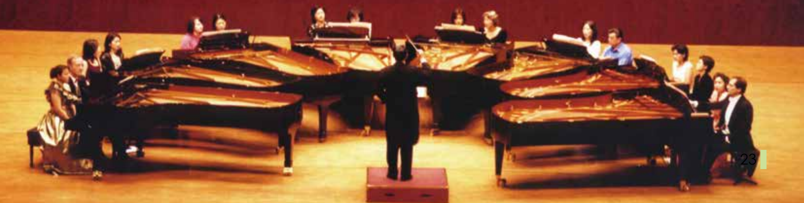
▼ 2002年「1至32隻手與八架鋼琴的邂逅」演奏會。