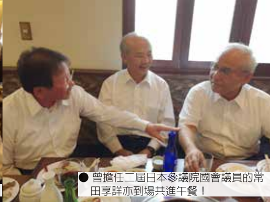
● 曾擔任二屆日本參議院國會議員的常田享詳亦到場共進午餐！