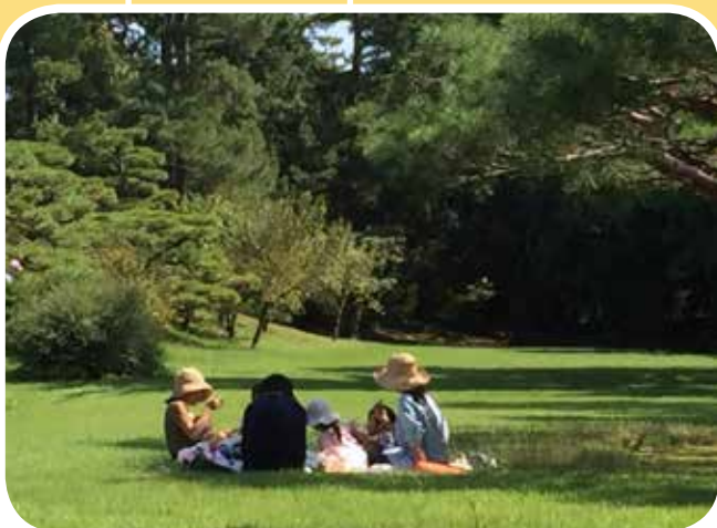
● 栗林是親子遊的絕佳地方。

台灣知日協會與台中市進出口公會攜手合作聯合拓展經貿，經過六天五夜有計劃的參訪與拜會活動，自此劃下完美的句點，在台灣對日經貿史上，亦史無前例的創下了資源共享的最佳典範，更建立了聯合拓訪的經貿模式。