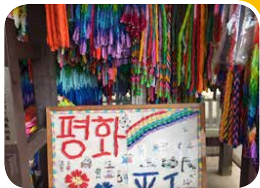
● 日本中小學生以紙鶴祈禱世界永遠和平。