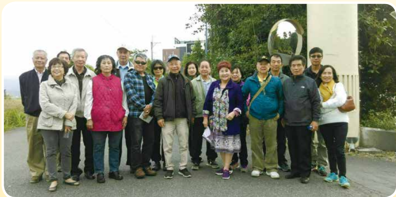
▲ 健行前於飯店入口合影。