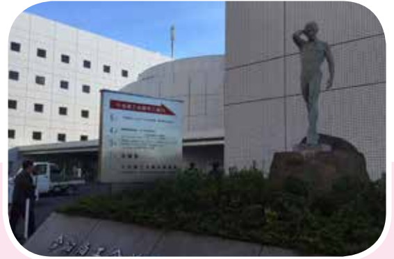
● 今治商工會議所大廈。

本團行程的安排由四國高松進，而後北上轉進日本本州山陰地區後，今天又回到四國愛媛縣的今治市，下榻於今治國際大飯店。