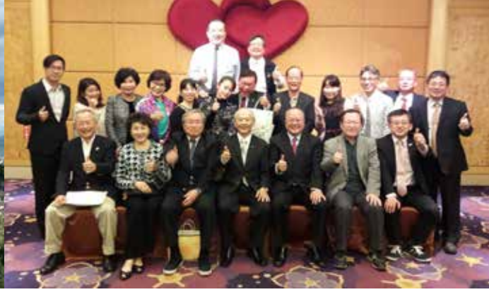
● 今治商工會議所一行八人回訪台灣。