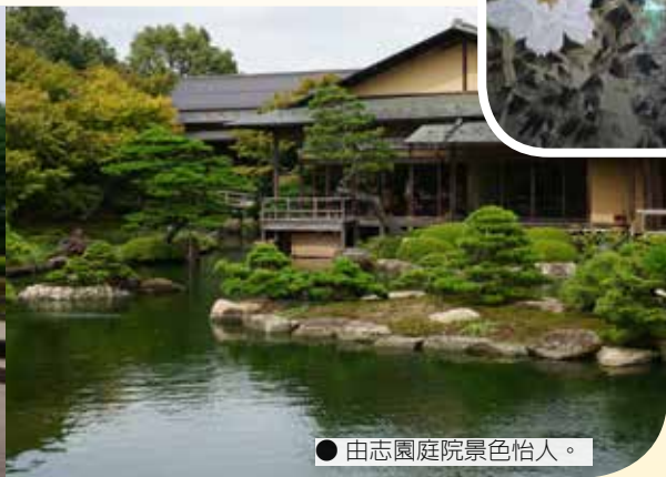
● 由志園庭院景色怡人。