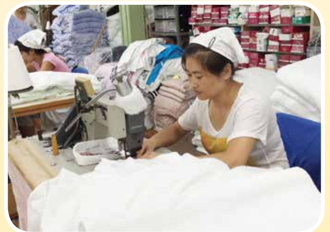
● 今治毛巾產業為日本賺取大量外匯，功不可沒。