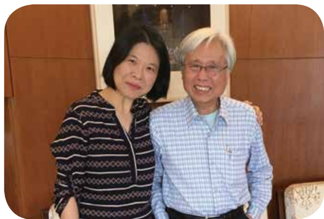
▲ 今年初巧遇多年未見恩師—賴德和老師(著名作曲家)合影。

循著台灣體制內音樂教育的發展，音樂升學之路競爭激烈，簡雪豐從光復國小音樂班、雙十國中音樂班，一路過關進入全台首屈一指的台北師大附中音樂班，最後進入國立台灣師範大學音樂系，完成令人稱羨的完整音樂教育。這歷程代表那時代最頂尖的一部台灣音樂教育發展史，完整呈現時代的音樂發展潮流。看似平穩、順利的音樂之路，在簡雪豐選擇遠赴德國留學之後，即將遇到另一層面的艱困與挑戰，但也形塑出最堅定精神的際遇。