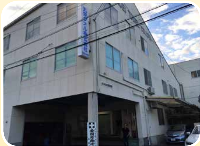
● 丸榮毛巾株式會社。