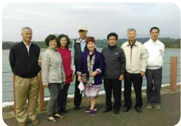
▲ 於仁義潭堤岸合影。