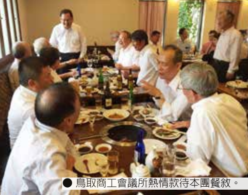
● 鳥取商工會議所熱情款待本團餐敘。