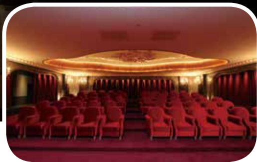
▲ 受訪地點：親家雲硯音樂廳。