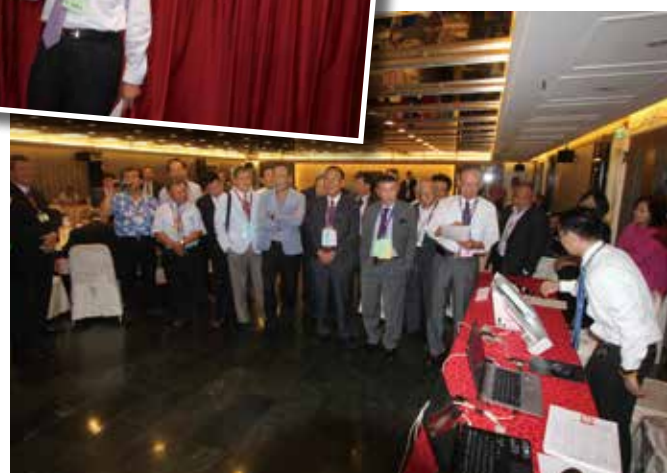
◆ 屏息以待投票結果。