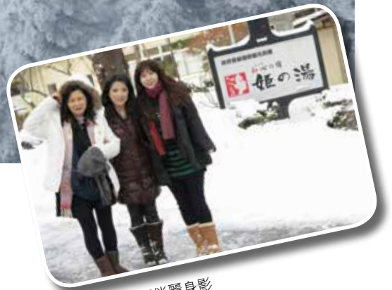
◆ 飯店前留下俏麗身影

有硫磺泉；有碳酸性等，各俱不同療效，可治百病，口耳相傳，遊客爭相泡湯嘗試療效，真是神奇。