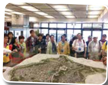
◆ 專注聆聽展示館裡的專業解說。