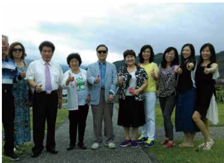
◆ 陰雨綿綿仍不減興致。

郵輪的行程就是吃吃喝喝，除了悠閒還是悠閒，個人覺得公主號郵輪安排的表演，鋼琴演奏、小提琴演奏、雜技演出…等等，都相當有水準，安排的電影也都是近半年的大片，譬如像聖母峰、死侍…，即使像我這樣隻身參加的人，也能樂在其中，大口吃著手作披薩，坐在星空下，仰望著超大的螢幕，月亮懸在天空，隨著船隻的航行，時而忽左時而忽右，這種感受只能在郵輪上了。雖然是這樣想著，但是，還是建議搭乘郵輪一定要找個伴，畢竟獨樂樂不如眾樂樂！而且！建議選擇陽台艙房，雖然說上去甲板上就可以看到蔚藍的海洋，可是一大早醒來，可以和朋友或者家人坐在陽台，看著一望無際的大海，或許來個客房早餐，也是另一種不一樣的感受。下一次，一起去吧！