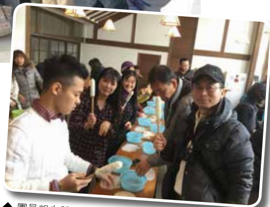
◆ 團員親自體驗DIY手作米棒

收。逛完了美麗的景色後，我們來到了繁榮的市區，仙台車站附近可是有著不少好玩好吃，好逛的地方呢!這晚，我們入住的旅館是Best Western Hotel仙台，正旁邊就是日本第二高的觀音菩薩佛像，身長高達一百公尺，旅客還可搭乘電梯從觀音內部升高到頂端享受絕佳視角。