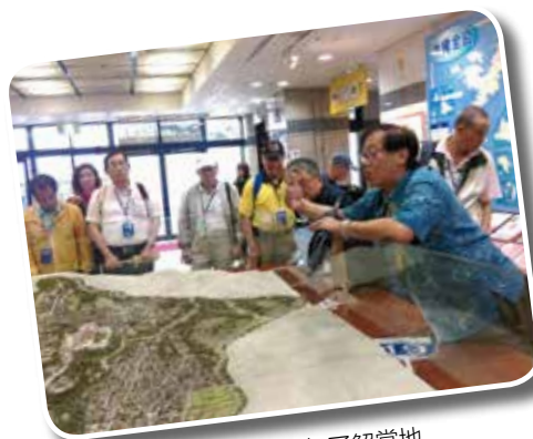
◆ 透過地理模型可以更加了解當地