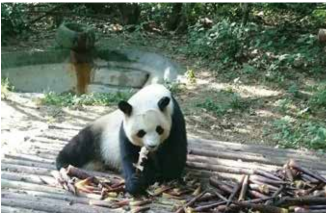
◆ 大熊貓模樣可愛討喜。

下午前往四川省博物館，素享“天府”盛譽的四川省，擁有秀麗的山川和遼闊的沃土，遍佈各地的名勝古跡和豐富多彩的出土文物，反映著四