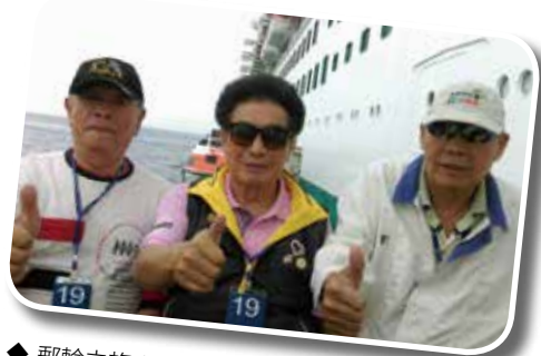
◆ 郵輪之旅充滿特殊體驗。