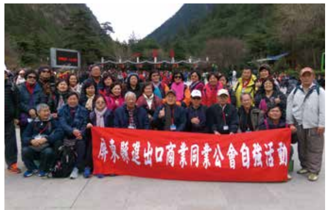
◆ 以秀美風景為背景合影留念。

晨喚早餐後驅車往牟尼溝風景區遊覽，牟尼溝風景區位於松潘縣西南牟尼鄉境內。占地面積160平方公里，最低海拔2800米，最高海拔4070米，年平均氣溫約4度。景區內山、林、洞、海等相應成輝，林木遍野，大小海子可與