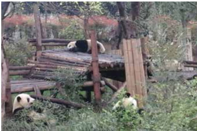
◆ 成都熊貓基地飼養許多熊貓。