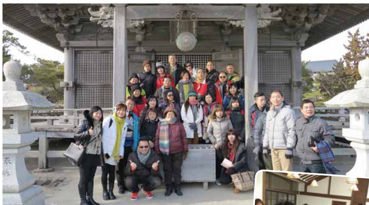
◆ 團員於五大堂前合影