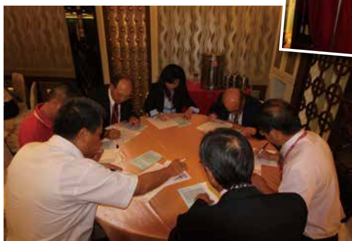
◆ 每位會員皆慎重填寫心目中人選。