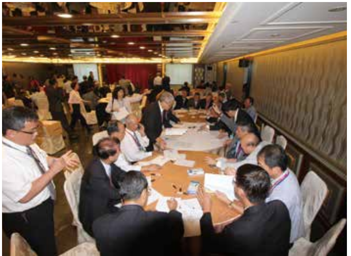
◆ 分別召開理事會和監事會。