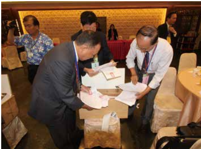
◆ 打開投票箱準備計票。